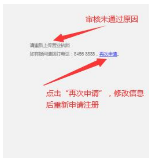
审核未通过原因页面

如果注册审核未通过，注册单位可以收到注册审核未通过原因的短信，也可在登录首页填写登录信息后查看审核未通过的原因，如图所示：