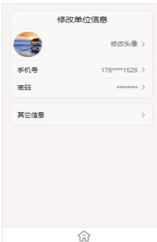
修改单位信息页面