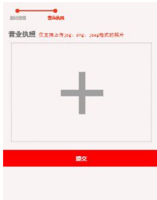
营业执照照片上传

点击并上传营业执照照片，完成照片上传操作后点击【提交】按钮完成注册操作（营业执照照片为必须上传项），如图所示：