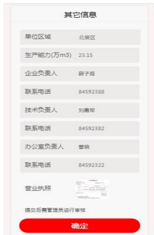
修改其它信息页面