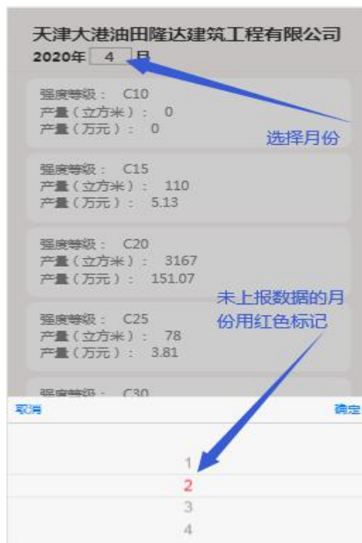
未完善生产数据月份展示

编辑生产数据：点击某一强度等级的生产数据框，进入编辑生产数据页面，填写产量和产值后点击【保存】按钮，完成生产数据编辑操作（产量和产值最多保留两位小数），如图