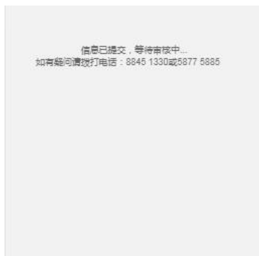
等待审核提示页面

登录信息后便可以进入用户首页；如果管理员审核未通过，在登录首页填写登录信息后便可以查看审核未通过原因，如图所示：