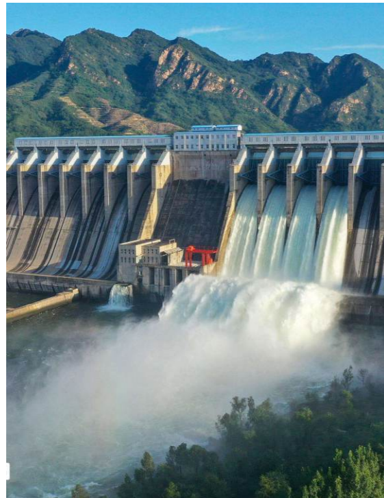
水利大坝安全监测

目前，智能数据采集模块已广泛应用于建筑基坑、水利大坝、边坡位移、地铁基坑等建筑安全监测项目中。