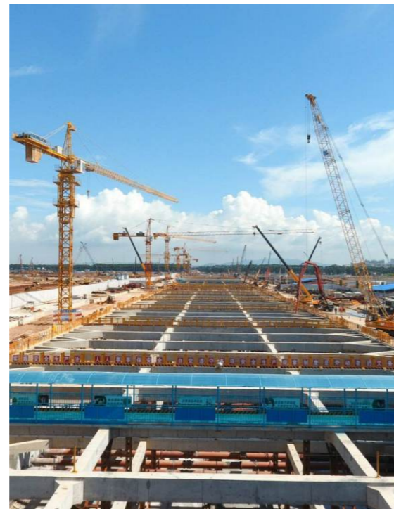
地铁基坑安全监测