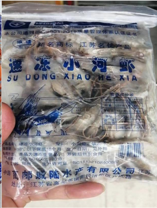
小河虾 (8 两) 1*16 袋 300/箱