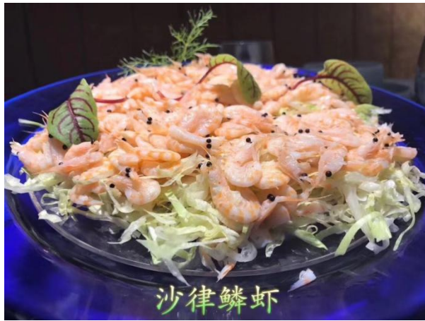
南极磷虾 200 克*50 块 300/箱