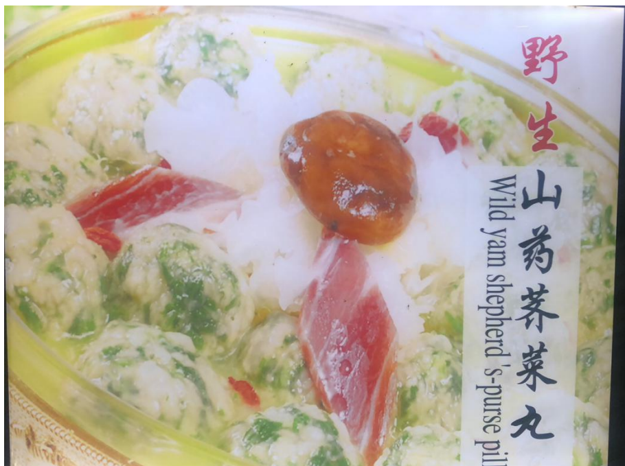
野菜丸子 3 斤*20 袋 900/箱