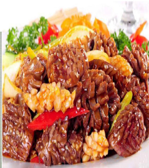
爽脆腰花 1 斤*20 袋 520/箱