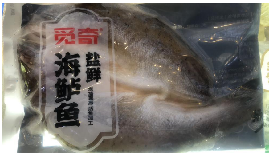
开背海鲈鱼（已开背已调味）650 克 19.9/条