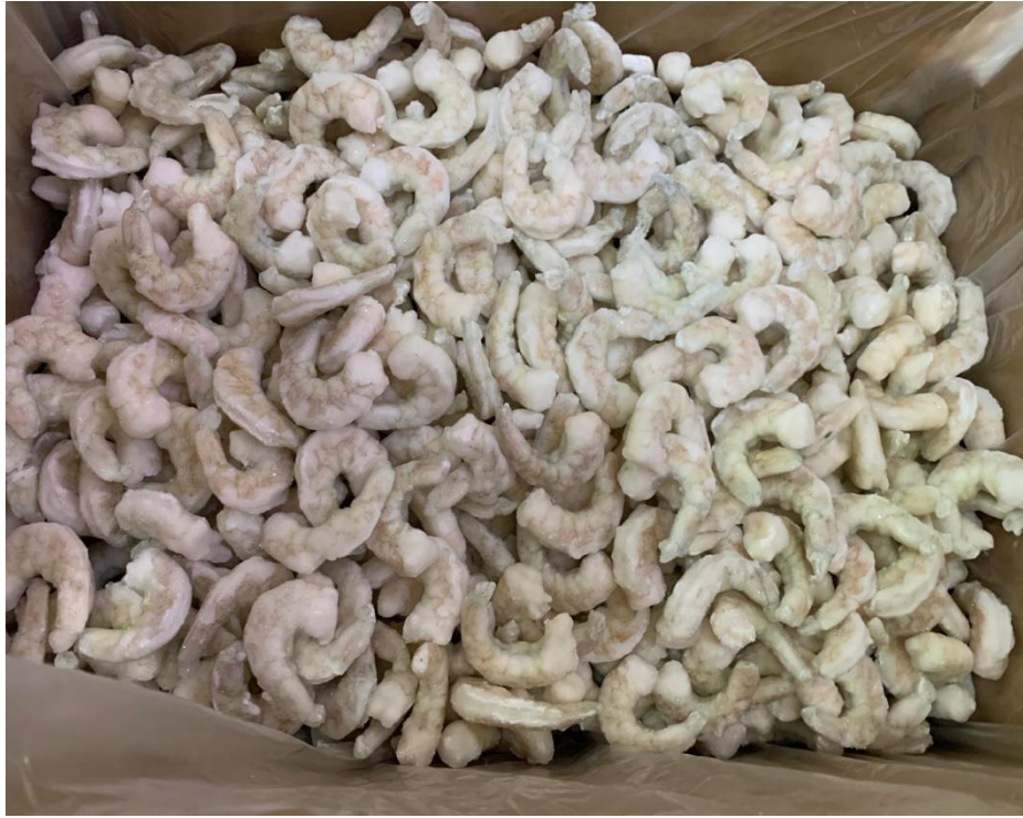
61/70 虾仁 净重 20 斤 490/箱