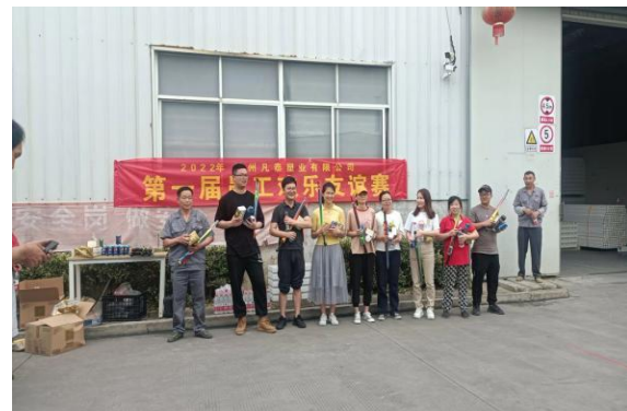
丰富多彩的员工文体活动