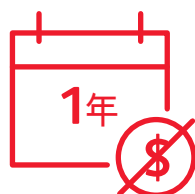
如失業或確診癌症 可享長達1年延繳保費保障