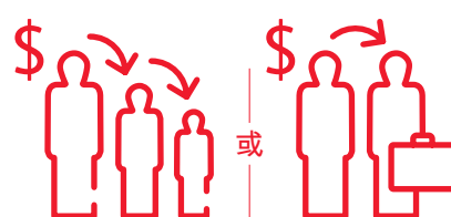
將財富及保障傳承後代或 公司要員