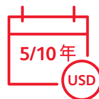
設有5年或10年供款年期 保單以美元結算