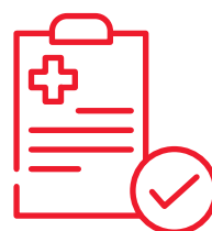
完成簡單健康申報 即可投保