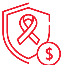
不幸患癌可獲 一筆過額外保障