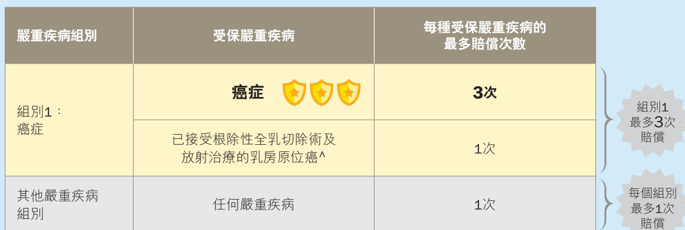
基本計劃及「多重附加契約」下的最多賠償次數

^ 「已接受根治性全乳切除術及放射治療的乳房原位癌」只在基本計劃的保障範圍之內。