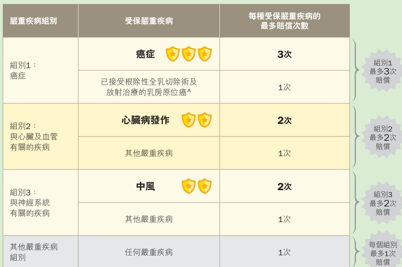
基本計劃及「多重附加契約 (加強版)」下的最多賠償次數

^ 「已接受根治性全乳切除術及放射治療的乳房原位癌」只在基本計劃的保障範圍之內。