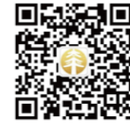
中國太平 唯一官方微信公眾號

本公司於2015年正式開業經營，深耕港澳，放眼全球。在競爭激烈的市場環境中實現跨越式發展，規模指標與價值指標雙雙實現大幅增長。