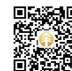
中國太平 唯一官方微信公眾號

本公司於2015年正式開業經營，深耕港澳，放眼全球。在競爭激烈的市場環境中實現跨越式發展，規模指標與價值指標雙雙實現大幅增長。