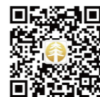
中國太平 唯一官方微信公眾號

本公司於2015年正式開業經營，深耕港澳放眼全球。在競爭激烈的市場環境中實現跨越式發展，規模指標與價值指標雙雙實現大幅增長。