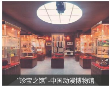
"珍宝之馆"-中国动漫博物馆