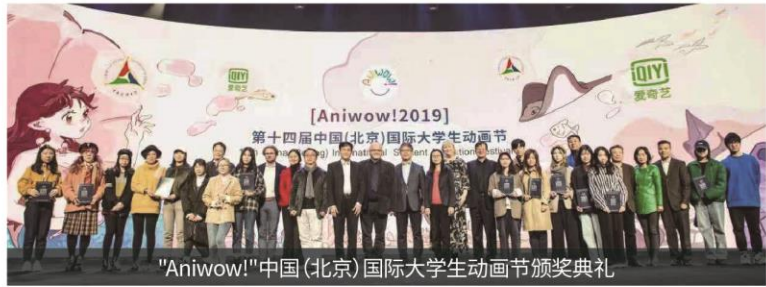
"Aniwow!"中国(北京)国际大学生动画节颁奖典礼