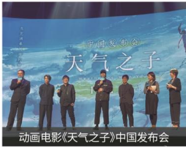
动画电影《天气之子》中国发布会