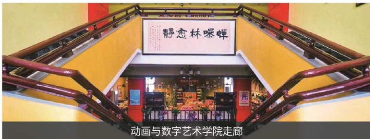
动画与数字艺术学院走廊