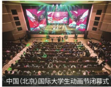
中国(北京)国际大学生动画节闭幕式