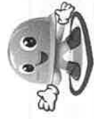
(扫描二维码可查询宣教产品目录)