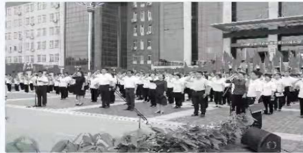
■滦州市职业技术教育中心在红色主题教育广场开展“赓续红色血脉、凝聚奋进力量”教师宣誓活动