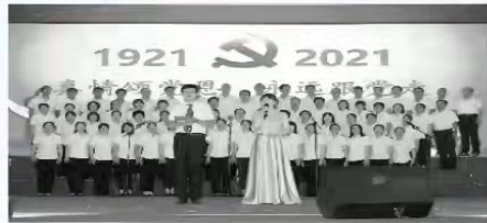
■滦州市职业技术教育中心举行“真情颂党恩、永远跟党走”歌唱比赛

为推进新时代学校思想政治建设工作，滦州市职业技术教育中心将社会主义核心价值观教育贯穿技术技能人才培养全过程，有效落实立德树人根本任务，全面深化“工学结合、知行合一”人才培养模式改革，强化工匠精神培育，摸索三全育人新方法，探索实践“一思三行”育人新格局。