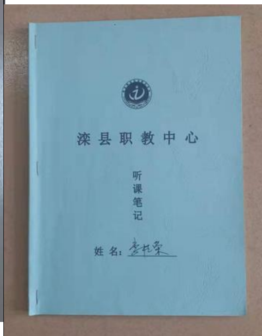
教师听课检查记录 2