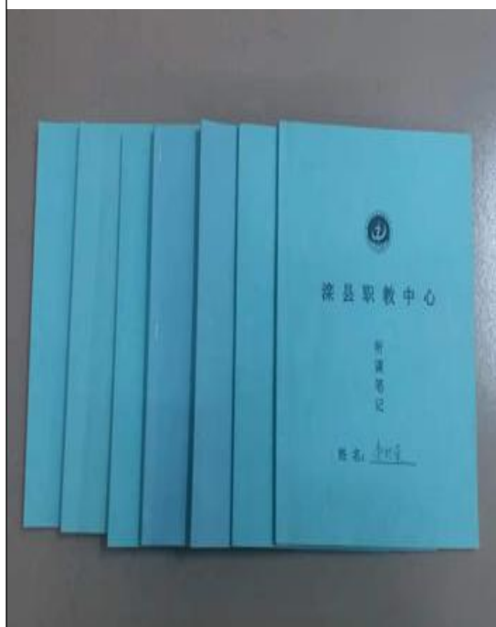
教师听课检查记录 2