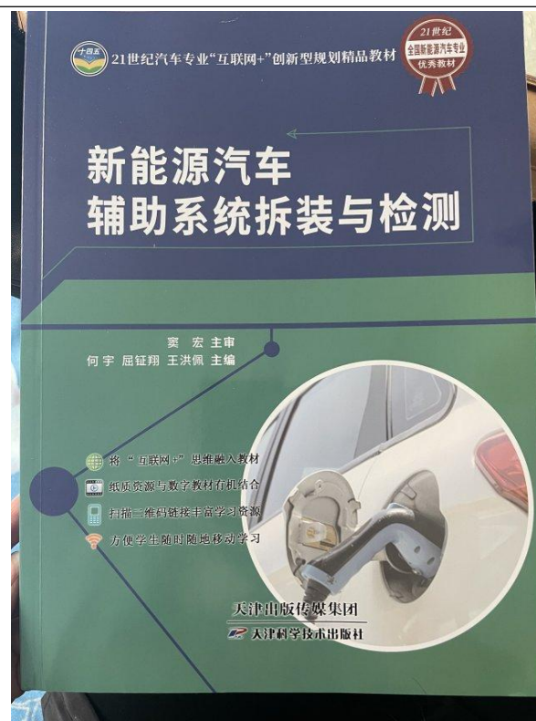
新能源汽修专业教材