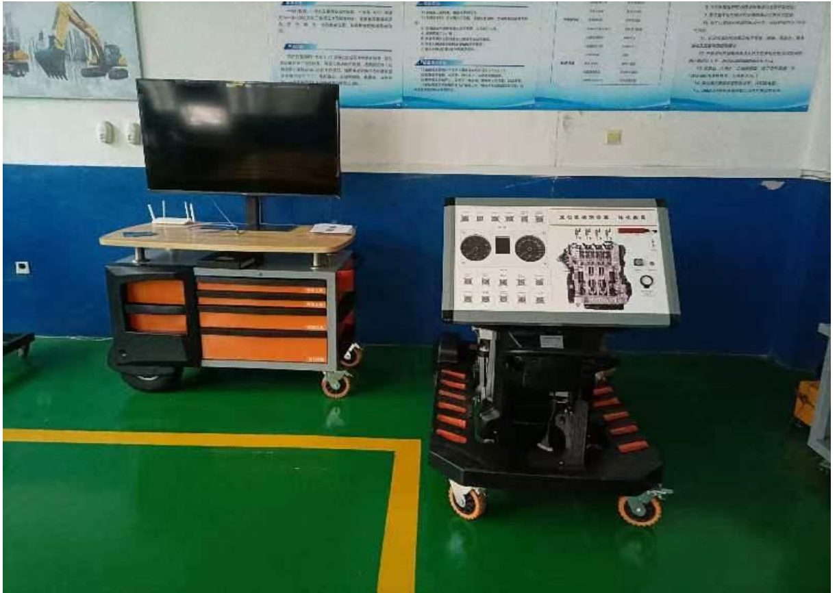
速腾 EA211 台架