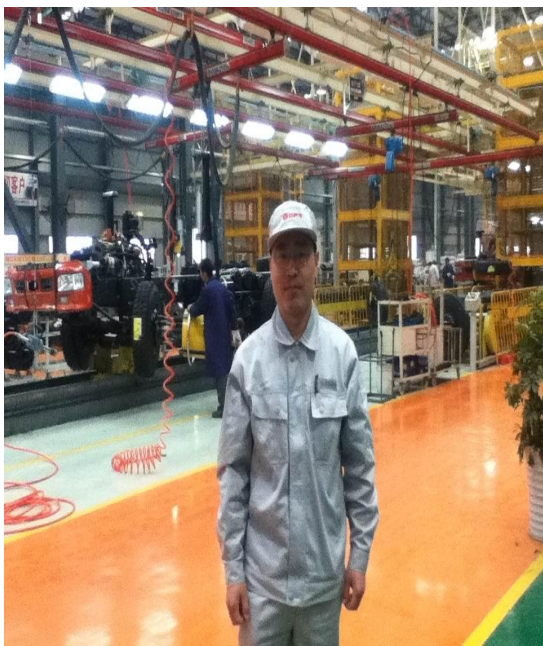
教师到东风商用车车间实践