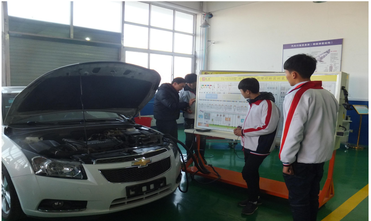
科鲁兹整车实训装置