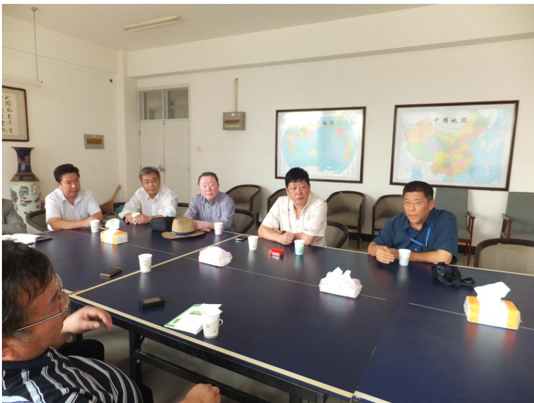
天津矢崎汽车有限公司企业调研