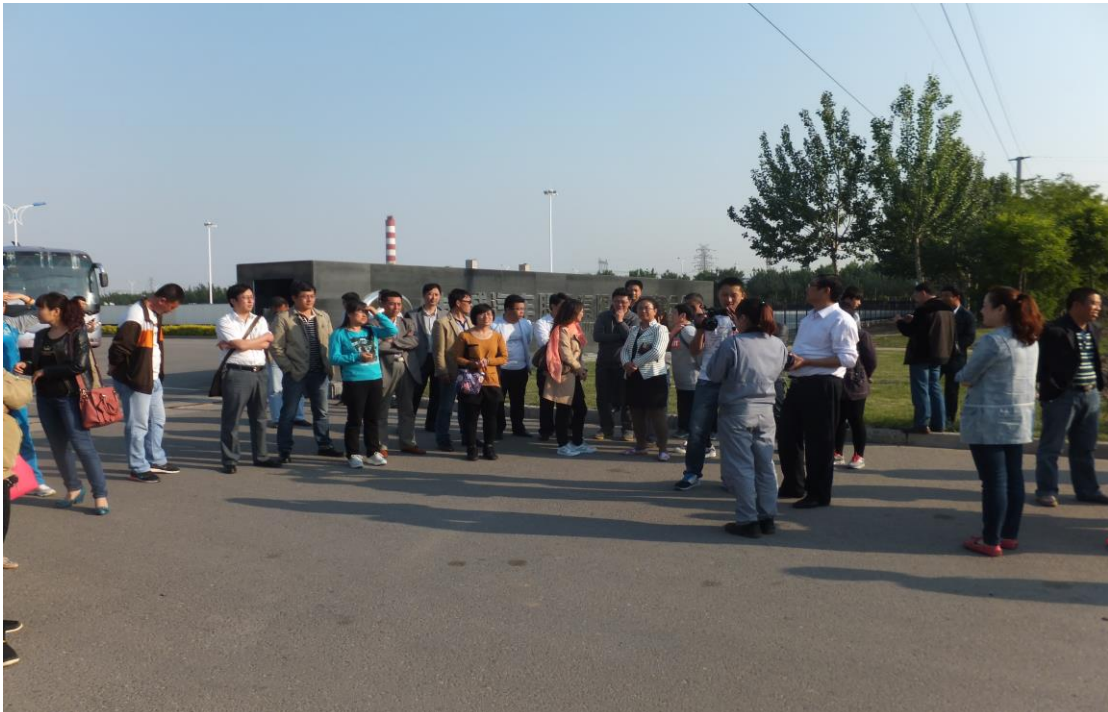
天津长城汽车公司调研