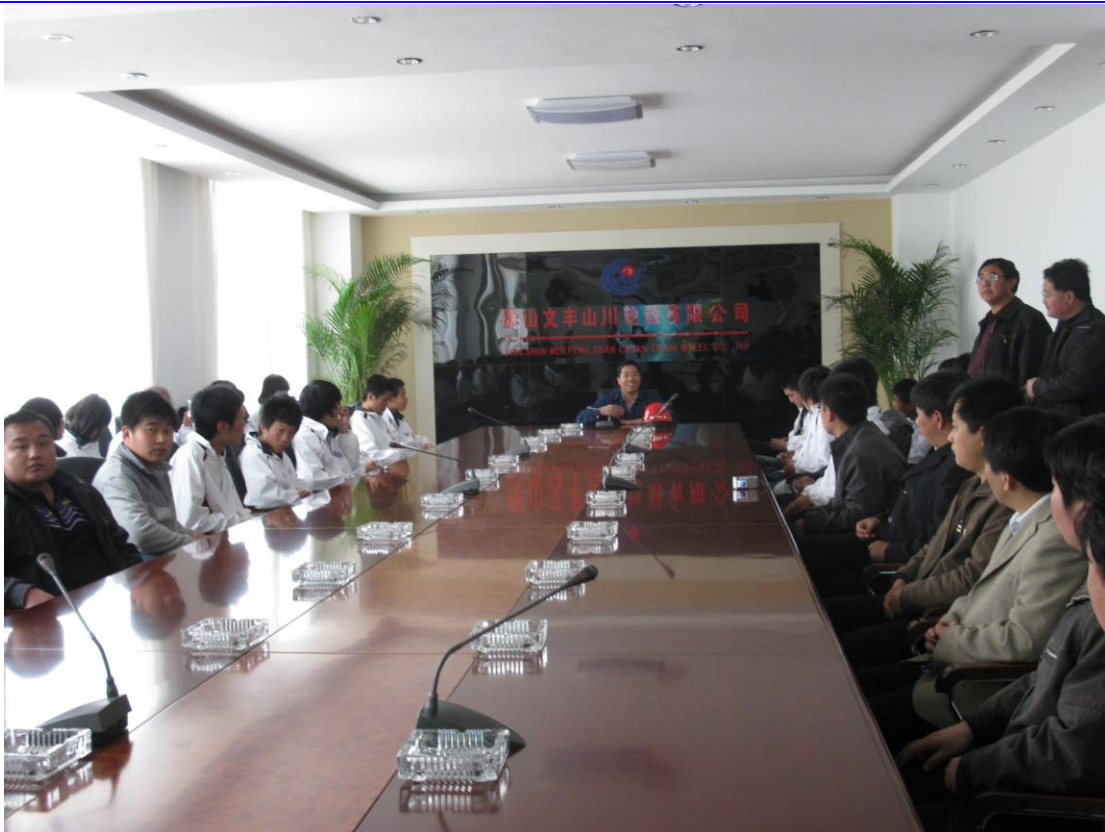
唐山文丰山川轮毂有限公司企业调研