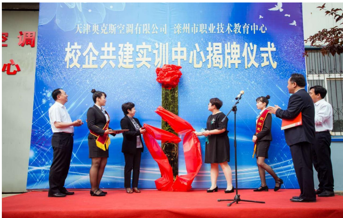
与天津奥克斯电气有限公司