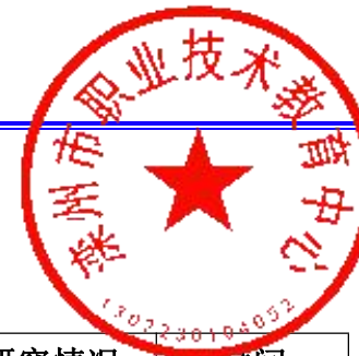
教师参与教学成果及课题研究情况统计表