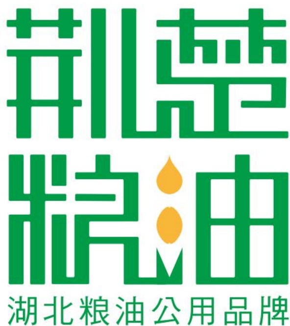
图 A.1 “荆楚粮油”品牌认定标志

注：1.荆楚粮油 logo 整体设计采用仿篆刻字体设计独立成型，字体结构结合荆楚文化“回形”纹路和高低山水写意，展现出湖北良好的自然生态环境和深厚的荆楚历史底蕴。