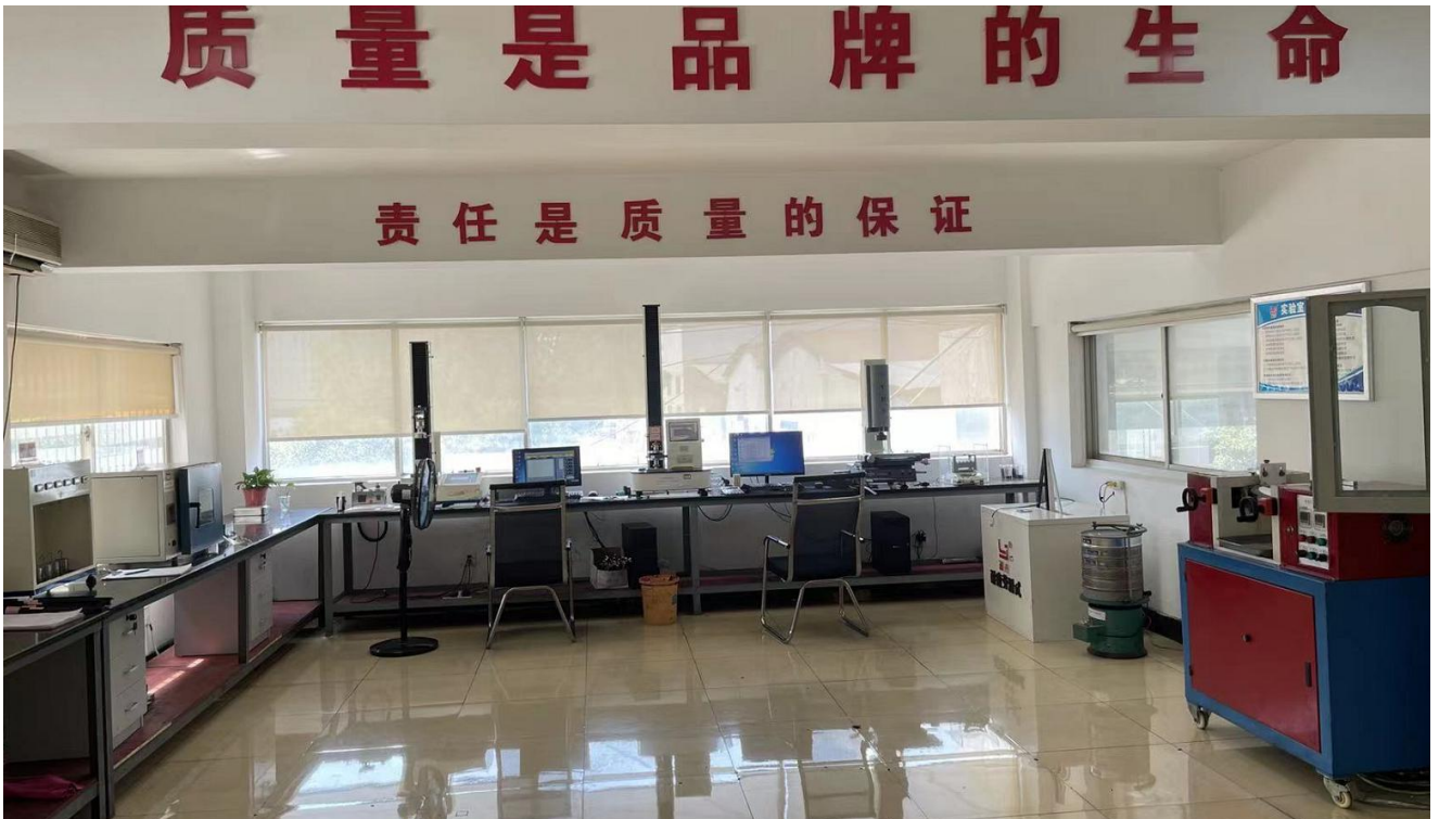
表 7 公司试验室照片

为保证所有产品在生产过程中都通过规定的检验后才能进入下一道工序，公司制定《不合格品/不符合控制程序》、《产品的监视和测量控制程序》开展严格的过程检验和试验。品质部负责制订过程及最终检验和试验规程，设立最终检验的检验点，并负责组织过程检验工作；质检员负责检验点的检查、半成品、成品的检验；各生产车间操作工负责自检工作。