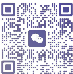
扫一扫上面的二维码图案，加我为朋友。