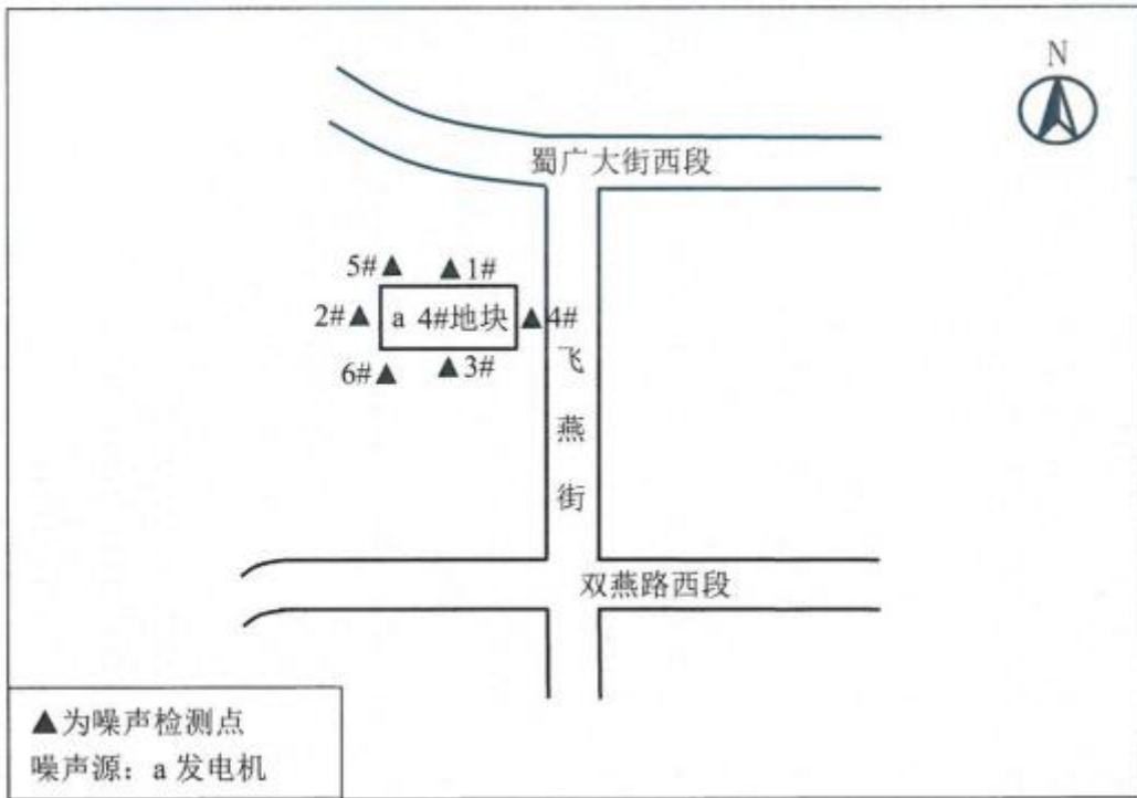
图 6-1 噪声监测点位示意图