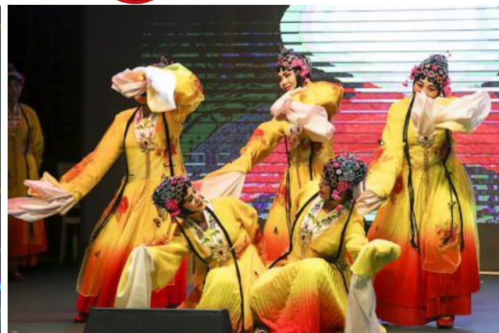
老年模特大赛、培训结业秀