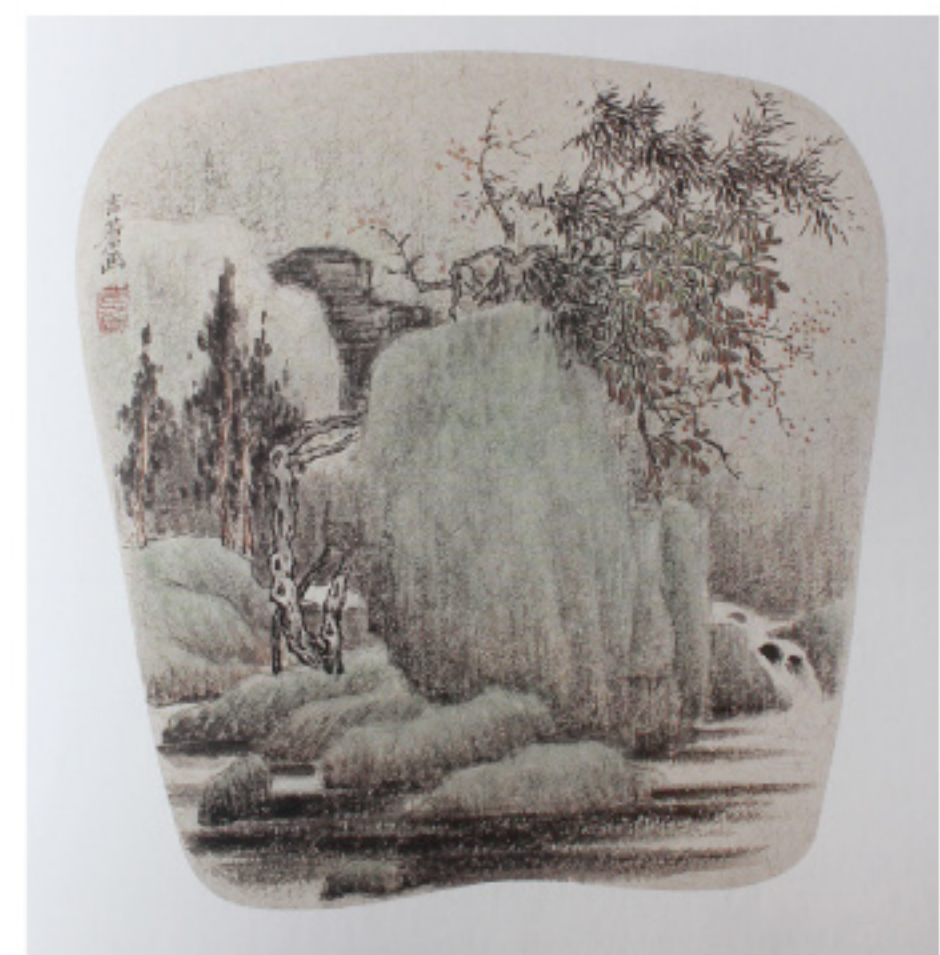
山水扇面 无锡苏吉昌

另悉，由工作室主创的108集电视连续剧剧本《万古风流苏东坡》，目前已完成了36集，2013年2月可望完稿。（常州黄智平）