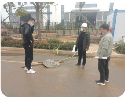
12日，公司下发了《关于开展全公司在监项目管井盖专项排查的通知》，13日上午，第二十九项目部组织了通知内容，随即对规划2号路、规划7号路、蓝天路西段市政工程项目进行专项检查。