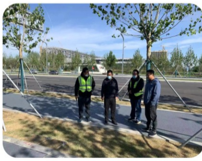
10日上午，第十一项目对道路排水和配套管线的给水、排水、电力管沟等管井开展拉网式排查。项目要求施工单位对存在的隐患部位立即整改，并在当日下午再次复查，全部整改到位。