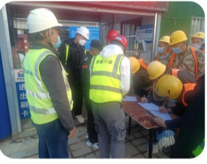
近期汉中疫情防控形势严峻，学府世家项目部把疫情防控作为当前的首要工作，认真落实防疫政策，对当前的防控工作再强调、再动员、再部署。