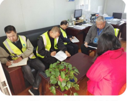
17日上午，汉中林供水项目部组织学习《中华人民共和国安全生产法》《关于进一步提升全市住建领域二十大后建筑施工安全管控的通知》及《高新监理双重预防机制下企业安全生产实施细则》