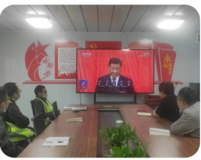
20日下午，第八十八项目部组织员工观看了中国共产党第二十次全国代表大会习总书记重要讲话的视频，认真领会党的二十大精神。