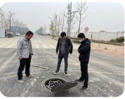
13日上午，富阎新区市政工程项目部组织建设单位现场代表，施工单位项目经理、项目总工及专职安全员等相关管理人员对管井盖进行安全专项检查。