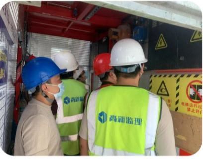
云水天境项目自20日实行全封闭管理以来，安全生产两不误，22日上午，云水天境三标段项目部组织人员开展安全生产检查。