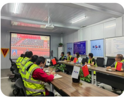
16日下午2点30分，咸阳机场项目部全体员工观看了党的二十大开幕盛况，认真学习了习总书记的重要讲话。