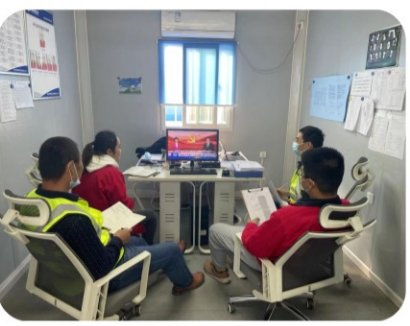
为深入学习宣传贯彻中国共产党第二十次全国代表大会精神，23日，高科云天项目部员工观看中共二十大报告，认真领会党的二十大精神。