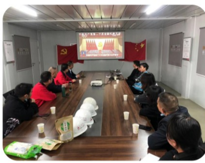
16日上午，汉水学校项目部组织全体项目管理人员、代建单位项目负责人观看了党的二十大开幕盛况，认真学习了习总书记的重要讲话。