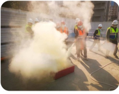
为预防工地出现突发状况，增强项目员工的应急能力，21日下午，经开第七小学分部项目组织开展了消防应急演练，项目员工参加了活动。