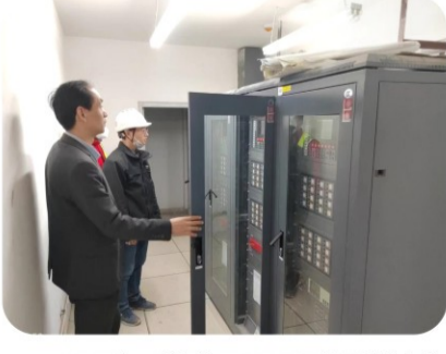
10日下午，创汇社区C区项目建设单位负责人、监理单位项目总监、物业公司代表组织开展消防设备使用、维护、保养的现场培训会，为顺利交房做好了前期铺垫。