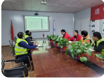
9日下午，南飞鸿广场项目部组织全员学习处务会上领导的讲话精神，并对监理通3.0的填写要求进行了全面学习。