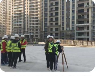
宝鸡分公司结合2022年度工作实施计划，于20日下午在碧桂园三期项目部开展了水准仪、靠尺、游标卡尺测量仪器的操作技能比武活动。