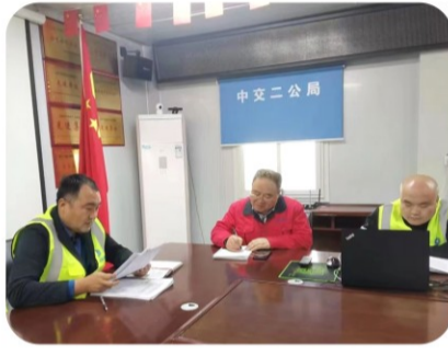
21日上午，生产技术研发基地建设项目召开了施工现场疫情防控专题会，对项目进行了疫情防控宣传教育，并联合施工单位对工地的疫情防控工作进行了检查。