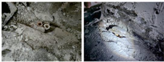
供暖管道截断未封堵

质量问题： 根据案卷资料并现场勘查，商铺二次装修时对于地面的做法采用原地砖上直接加铺地板的方式，涉案商铺供暖方式为地暖，但室内未见分水器及相关附属设施，对商铺内储藏室东南角地面破除后可见供暖管道为被截断状态，管道截面未封堵措施系截断后直接加铺了地砖。