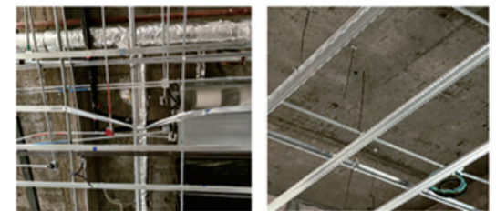
龙骨变形、烟感器、喷淋吊杆倾斜、混用，部分头等位置错乱与龙骨未连接

质量问题： 现场对涉案医院内过道、大厅及所有房间的吊顶进行检查，可见吊顶施工过程中存在吊杆混用现象，吊顶内电气穿线管与吊杆龙骨使用同一根吊杆；龙骨有不平整、变形现象，龙骨连接处螺丝松动，多处未贯通且表面有锈迹；吊杆有打弯、倾斜、松动、生锈现象，吊顶内采用射钉、射钉两种方式进行固定；部分吊顶上灯具和烟感器、喷淋头及空调风口排列错乱，安装位置间距不合理，存在碰撞现象。以上吊顶存在的质量问题不符合《建筑装饰装修工程质量验收标准》（GB 50210-2018）第7.1.9条、第7.1.13条、第7.2.3条、第7.2.4条相关规定。