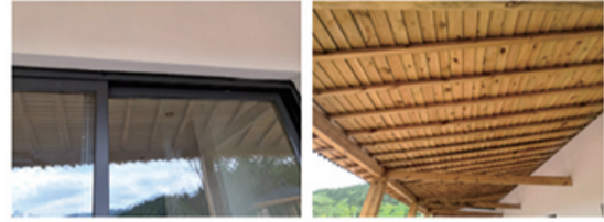
窗框与墙体之间未采用密封胶密封

质量问题： 根据案卷资料及现场勘查情况，涉案房屋门窗框与墙体之间未采用密封胶密封，不符合《建筑装饰装修工程质量验收标准》（GB/T50210-2018）6.3.7条的相关规定。涉案房屋吊顶上木基层板、木饰面板、木龙骨等木构件未按设计和防火规范要求进行防火、防腐、防虫处理，不符合《建筑装饰装修工程质量验收标准》GB50210-2001第3.2.9条及第6.1.8条规定。吊顶乳胶漆颜色局部泛黄，不符合《建筑装饰装修工程质量验收标准》（GB/T50210-2018）7.2.6条规定。