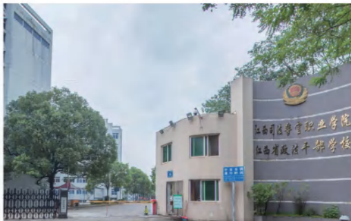
江西司法警官职业学院

江西省唯一一所政法类大专（高职）院校，隶属于省司法厅的——江西司法警官职业学院！