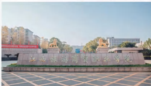
江西旅游商贸职业学院

江西现代职业技术学院 (Jiangxi Modern Poly-technic College), 位于江西南昌, 创办于 1978 年, 隶属于江西省国有资产监督管理委员会, 现有全日制在校生 1.6 万余人。学院系国家骨干高职院校、江西省优质高职院校、江西省高水平高职院校立项建设单位、江西省首批联合培养应用型本科人才试点院校、江西省职业院校“1+X”证书试点牵头单位、全省高校文化创意园建设试点单位,