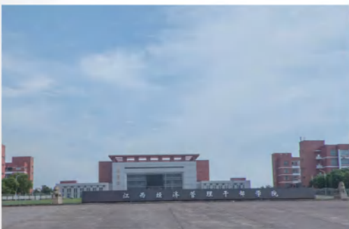
江西经济管理干部学院

江西旅游商贸职业学院 (Jiangxi Tourism & Commerce Vocational College) 是 2002 年 4 月经江西省人民政府批准组建的一所旅游商贸类公办全日制普通高等院校, 位于江西南昌, 占地面积 1068 亩, 现有各级各类在校生 17000 多人, 是江西省示范性高职院校、江西省高水平高职院校、全省首批应用技术型本科人才培养院校等, 学校拥有文、理、工、艺术、体育等多种学科, 设有旅游、经济管理、会计金融、国际商务、机电与建筑工程、艺术传媒与计算机、体育等 7 个学院, 开设有 50 多个专业。