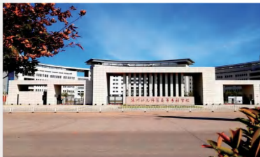
抚州幼儿师范高等专科学校

江西陶瓷工艺美术职业技术学院 (Jiangxi Arts & Ceramics Technology Institute) 位于举世闻名的世界瓷都景德镇市，创建于 1958 年，隶属于江西省教育厅，现有全日制在校生 1.2 万余人，学校为教育部首批教育信息依试点单位、教育部第三批现代学徒制试点单位、教育部示范性职业教育集团培育单位、教育部 1+X 证书试点院校、国家能大师工作室”、中国工艺美术非遗传承基地、全国中小学陶艺培训基地，江西非物质文化遗产传承基地、省“新材料产业产教融合育人基地”、江西省示范性高职院校，江西省首批联合培养应用型本科人才试点单位院校、江西省高水平高顺院校建设立项单位和江西省优势特色专业建设立项单位。学院每年的就业率、创业率均居省内同类院校前列，连续三届被评为就业工作评估优秀单位。