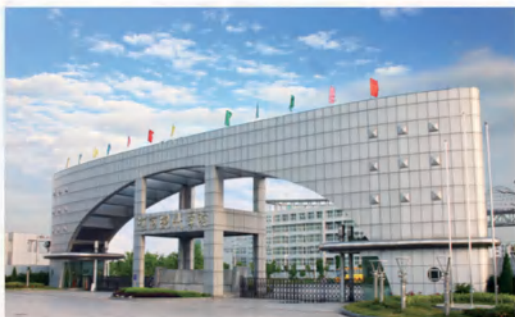
江西现代职业学院

江西现代职业技术学院 (Jiangxi Modern Poly-technic College), 位于江西南昌, 创办于 1978 年, 隶属于江西省国有资产监督管理委员会, 现有全日制在校生 1.6 万余人。学院系国家骨干高职院校、江西省优质高职院校、江西省高水平高职院校立项建设单位、江西省首批联合培养应用型本科人才试点院校、江西省职业院校“1+X”证书试点牵头单位、全省高校文化创意园建设试点单位,