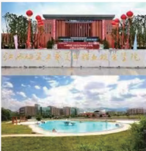
江西陶瓷工艺美术职业技术学院

江西司法警官职业学院前身是 1958 年成立的江西政法学院（后分为三个学校，即江西省公安专科学校、江西省劳改警察学校和江西省司法学校），2000 年江西省司法学校和江西省司法警官学校成建制合并为江西司法警官学校，2002 年 4 月经省人民政府批准成立江西司法警官职业学院，并保留江西省政法干校的职能，2013 年 5 月，江西省机构编制委员会同意学院增挂“江西省司法厅警察训练总队”牌子。