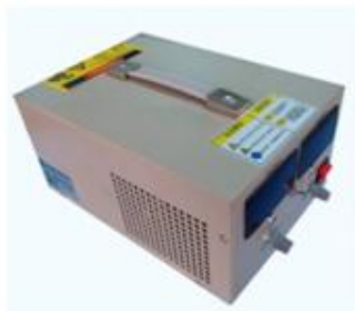
2000W 直流稳压恒流开关电源 产品型号: KYHY-2000 输出功率: 2000W 输出电压: DC 0~100V, 连续可调 输出电流: DC 0~20A, 连续可调 外形尺寸: 宽*高*深 =198mm*130mm*320mm 整机重量: 约4.5kg