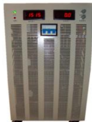
30KW 直流稳压恒流开关电源 产品型号: KYHY-30000 输出功率: 30KW 输出电压: DC 150~1500V, 连续可调 输出电流: DC 3~33A, 连续可调 外形尺寸: 宽*高*深 =330mm*620mm*560mm 整机重量: 约75kg