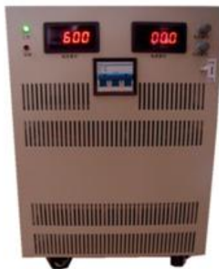
20KW 系列可调直流开关电源 产品型号: KYHY-20000 输出功率: 20KW 输出电压: DC 60~600V, 连续可调 输出电流: DC 5~20A, 连续可调 外形尺寸: 宽*高*深 =315mm*400mm*550mm 整机重量: 约40kg