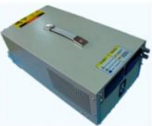
5000W 系列可调直流开关电源 产品型号: KYHY-5000 输出功率: 4950W 输出电压: DC 0~165V, 连续可调 输出电流: DC 0~30A, 连续可调 外形尺寸: 宽*高*深 =255mm*155mm*420mm 整机重量: 9kg