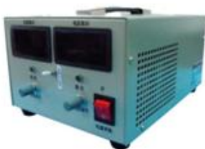
1000W 系列可调直流开关电源 产品型号: KYHY-1000 输出功率: 960W 输出电压: DC 0~96V, 连续可调 输出电流: DC 0~10A, 连续可调 外形尺寸: 宽*高*深 =198mm*130mm*280mm 整机重量: 4kg