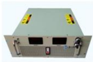
10KW 系列可调直流开关电源 产品型号: KYHY-10000 输出功率: 10KW 输出电压: DC 50~1000V, 连续可调 输出电流: DC 2~10A, 连续可调 外形尺寸: 宽*高*深 =483mm*152mm*420mm 整机重量: 约22kg