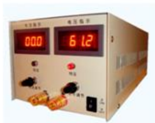
产品型号: KM-6050T 输出功率: 3000W 输出电压: DC 0~60V, 连续可调 输出电流: DC 0~50A, 连续可调 外形尺寸: 宽*高*深=185mm*140mm*400mm 整机重量: 约6kg